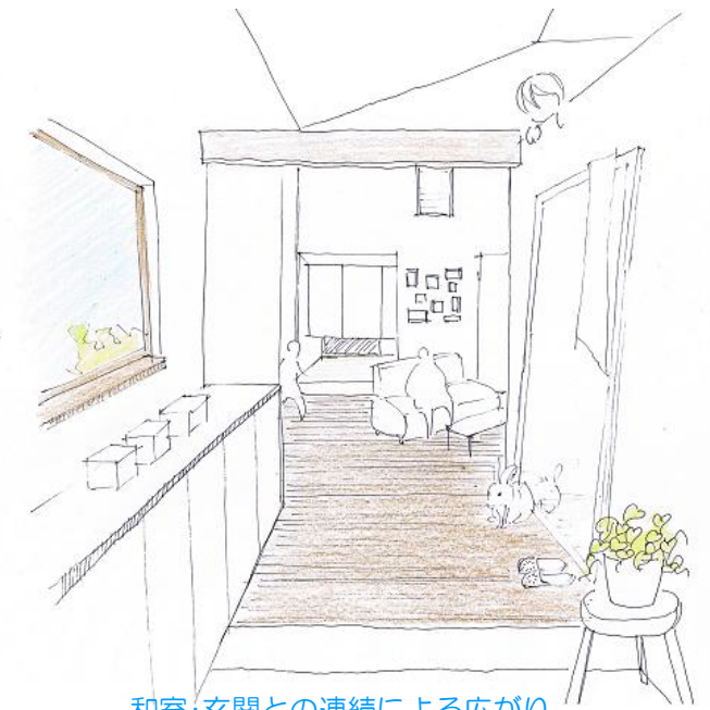
和室・玄関との連続による広がり

一体的なLDKですが、キッチンを含んでリビングとダイニングを対角に配しています。 キッチンと対面するリビングとは別に、家族の様々な活動の場となるダイニングをゆるやかに 分けることで、来客時も気兼ねなく宿題をしたり本を読んだりできます。 キッチンと横につながるダイニングへの動線は効率よく、配膳はもちろん子ども達のお 手伝いにも便利です。