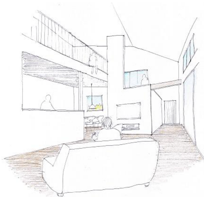
対角線による広がり

子ども達の遊び場、 お母さんのガーデニング、 お父さんのDIYで楽しさが広がります。 お母さんの作ったお野菜、 それを使ったお父さんの料理、 日曜日の楽しみが味わえる庭です。